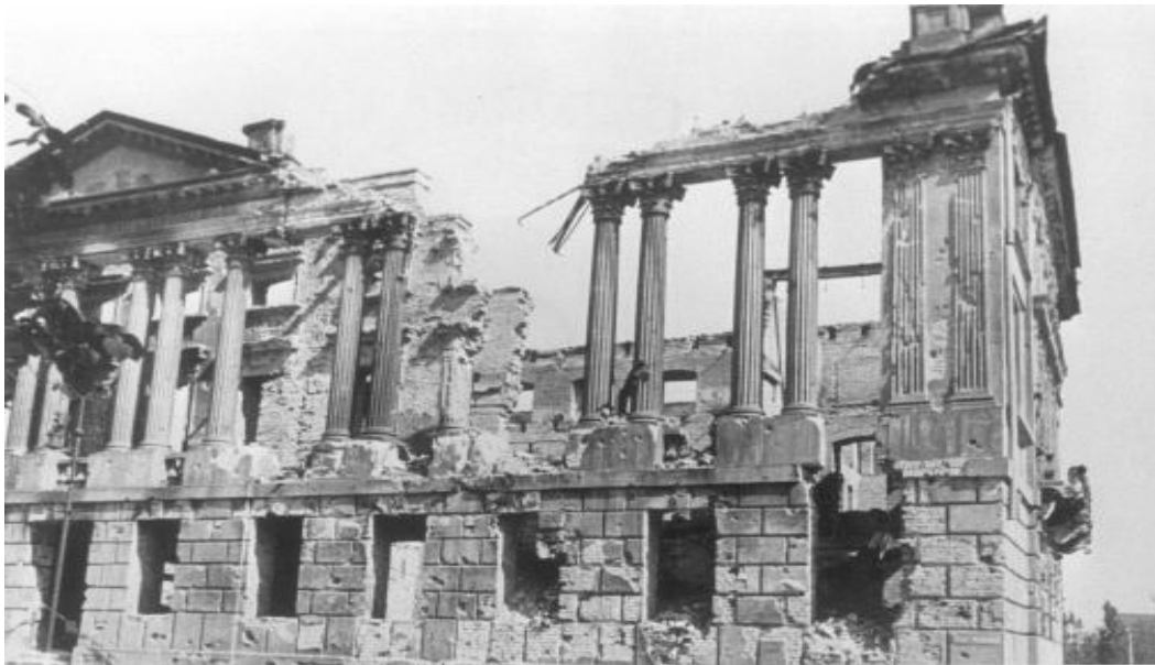
Biblioteka Raczyńskich rok 1945