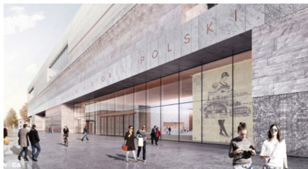
Wizualizacja – widok budynku Muzeum Historii Polski od strony Placu Gwardii (wejście główne). Projekt: WXCA