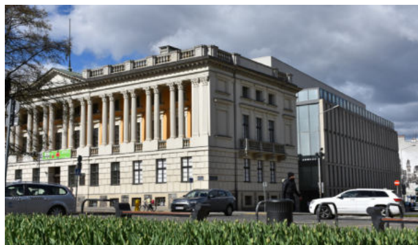
Biblioteka Raczyńskich

Księgozbiór Biblioteki Raczyńskich liczy dziś niemal 2 miliony woluminów. Najcenniejsze pod względem naukowym i zabytkowym są zbiory specjalne, na które składają się rękopisy, stare druki, kartografia, grafika, fotografie,