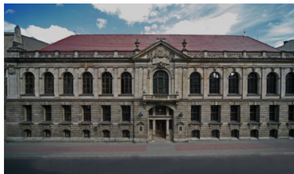
Biblioteka Uniwersytecka w Poznaniu, fot. Rafał Michalowski

W Bibliotece Uniwersyteckiej znajduje się pięć czytelni: Czytelnia Nauk Humanistycznych, Czytelnia Pracowników Nauki, Nova. Czytelnia Komiksów i Gazet, Czytelnia Nauk Społecznych, Czytelnia Zbiorów Specjalnych i Regionalnych. Ponadto sala do pracy grupowej zapewnia użytkownikom odpowiedni komfort, sprzyjając koncentracji bądź integrując środowiska, a dogodne godziny