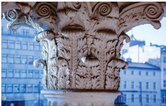
Biblioteka Raczyńskich (fragment budynku)