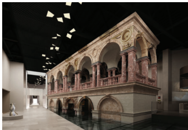
Wizualizacja – wystawa stała MHP (galeria Dawna Rzeczpospolita). Projekt WWAA, Platige Image